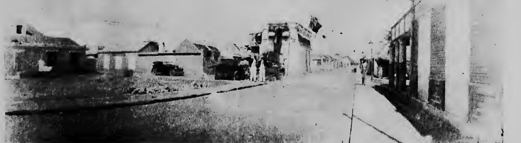
De Nassaustraat in 1929, toen de Lago zich vestigde in San Nicolaas.